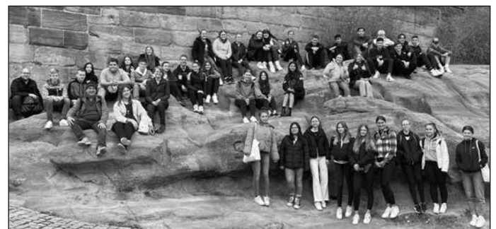
Studienfahrt der Q11 nach Nürnberg