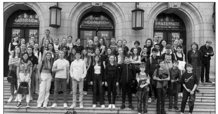
Teile der 10. Klassen im Schüleraustausch in Südfrankreich

Fahrten nach Nürnberg und Schüleraustausch mit Frankreich