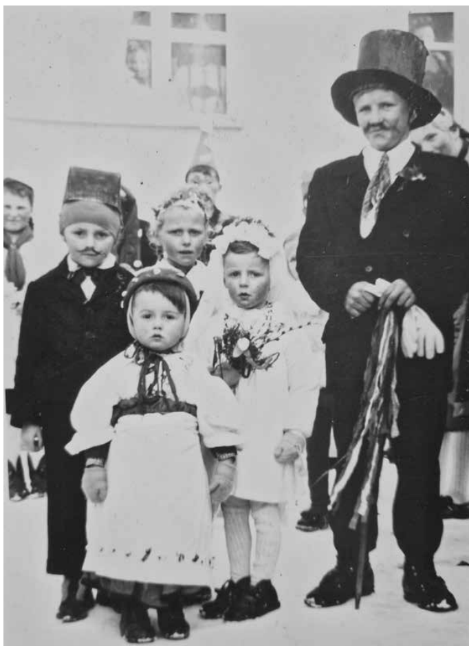
Faschingszug St. Oswald ca. 1956