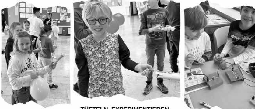
TÜFTELN, EXPERIMENTIEREN, MIT SPANNENDEN VERSUCHEN NATUR UND TECHNIK LIVE ERLEBEN

dazu waren die Viertklässlerinnen und Viertklässler aus den umliegenden Grundschulen ans LLG eingeladen.